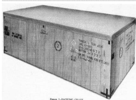
Figure 2-PACKING CRATE

Conceived mainly as a reconnaissance vehicle to replace the motorcycle and sidecar of World War I, the Jeep's service record went far beyond scouting and dispatch riding. Jeeps carried troops (well and wounded), mounted guns, hauled supplies, guarded lines, and provided bone-jarring transportation for everyone from rank and file GIs to commanding generals and VIPs.